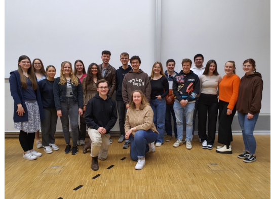
Aktuelle STUDYPEDIA-Teilnehmer*innen Studienjahr 2022/23